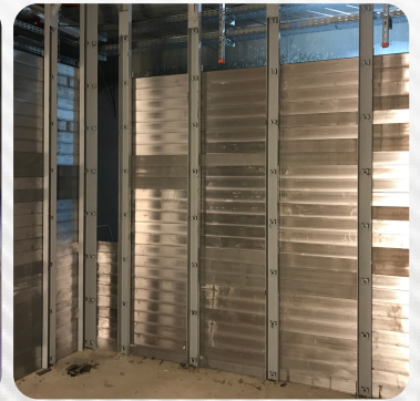
Accatastamento di mattoni di piombo