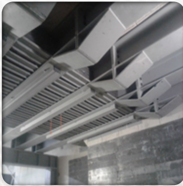
Traversine di supporto a lunga portata

CONTATTATECI PER UNO STUDIO APPROFONDITO