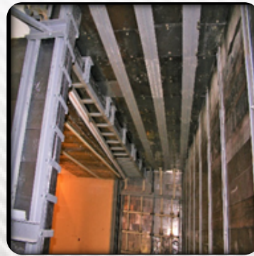
Soffitto e parete in piombo